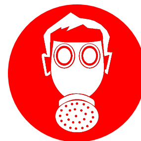
Изображение знака M 04